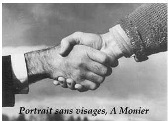
Portrait sans visages, A Monier